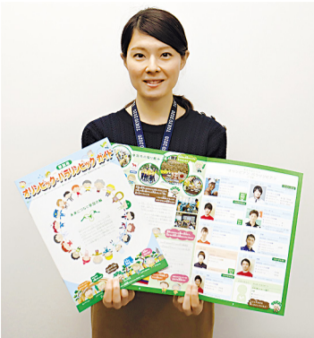
小中学生向けに作成した「オリピック・パラリンピックガイド」

小中学生向けオリパラガイド 草加市オリピック・パラリンピック推進委員会(事務局・草加市スポーツ振興課)はこのほど、市内小中学生向けの冊子「オリピック・パラリンピックガイド」を作成した。 ガイドは、オリピック・パラリンピックの意義や歴史、草加市の取り組みなどで構成。スポーツ振興課オリジナルキャラクター「松の木先生」「エタメちゃん」など5体をガイド役にして親しみやすくした。 A4サイズ全8ページ、カラー4万部発行。小中学校に配布し授業や家庭学習で活用のほか、希望の学校には出前授業も行う。市内公民館・文化センターなどでも配布。 △問い合わせ 市スポーツ振興課オリピック・パラリンピック推進室 ☎922-3493。