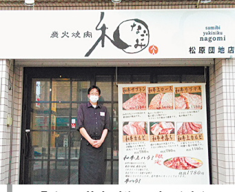
「和」草加松原店(上)、牛刺しと牛ユッケ(下)

獨協大学前駅東口から徒歩2分、草加市栄町にあります炭火焼肉「和」草加松原店。和質の良い食材をどれだけ安く提供出来るか?を心掛けたリピーター客の